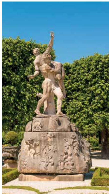
Escultura de Hades secuestrando a Perséfone, Mirabell Gardens, Salzburgo, Austria. En la mitología griega, Hades, alude tanto al antiguo inframundo griego como al dios de éste.

En este tiempo, Escorpio nos da la suficiente intensidad para tolerar el conflicto que nos genera el miedo, nos da la valentía para ir a las profundidades, a enfrentar el dragón que habita en lo más hondo del inconsciente. Júpiter podría poner la lupa al dragón, ¡y éste podría verse más grande! Pero también estará presente la naturaleza expansiva y direccionada de Júpiter, la confianza en el camino y la búsqueda, el toque de “suerte” que viene con su presencia.